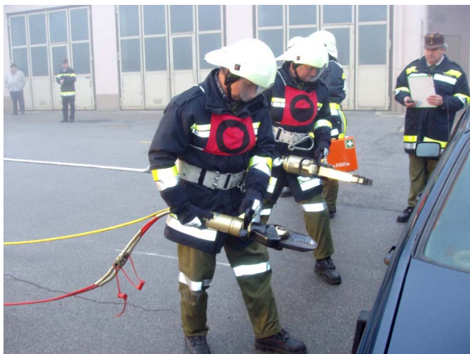
Wirklichkeitsnahe Ausbildung bei der