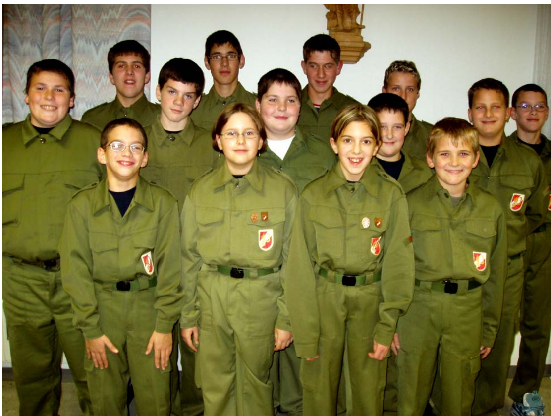
Die neue Gföhler Feuerwehrjugendgruppe.

Wir begrüßen als Mitglieder der Gföhler Feuerwehrjugend: