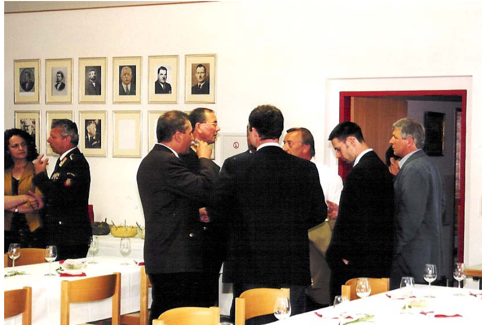
Im Schulungsraum erfolgte die Bewirtung der Ehrengäste des Festaktes. Im Hintergrund die Kommandanten-Galerie

von allen Kommandanten Fotos aufgetrieben werden. Ein weiteres Bild führt alle Kommandanten seit Gründung – es sind insgesamt bisher 14 – mit ihrer jeweiligen Funktionsdauer an. Diese Galerie wurde bisher von allen Besuchern, so auch des Festaktes anlässlich der 135-Jahr-Feier, als vorbildlich gelungen bezeichnet.