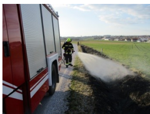
20.3.2019 – Flurbrand Langenloiser Straße