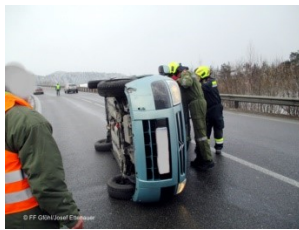
25.1.2019 – B37 – PKW kippte zur Seite