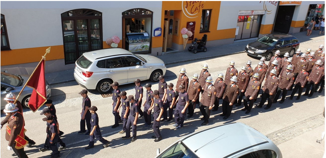
Fronleichnamsprozession 2019

Am Donnerstag, 20. Juni 2019, haben die zur Pfarre gehörigen Feuerwehren Eisengraben, Gföhl, Jaidhof und Reittern und die Feuerwehrjugend an der Fronleichnamfeier teilgenommen. Auch Mitglieder des Roten Kreuzes Gföhl und des ÖKB Gföhl waren bei der Feldmesse am Hauptplatz und der anschließenden Prozession durch den Ort mit dabei.