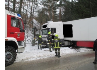
12.1.2019 – LKW steckt fest – Wurfenthalstraße