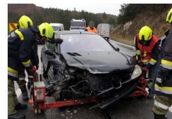
28.10.2019 – B37 – PKW gegen Leitschiene