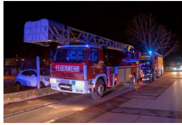
2.1.2019 – Drehleiter Gföhl -Brand KH Krems–