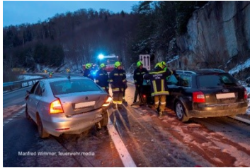
11.1.2019 – B37 – Unfall mit 4 PKWs