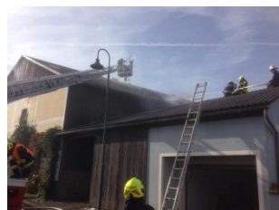
25.10.2019 – Drehleiter Gföhl – Brand Marbach/Felde