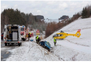
2.1.2019 – B37 – 2 Personen eingeklemmt