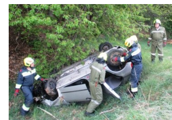
27.4.2019 – B37 – PKW auf Dach in Graben