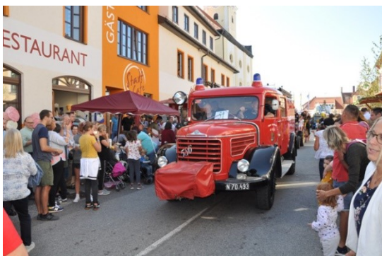
Die FF Gföhl hat mit dem TLF 2000, Baujahr 1963, am Umzug teilgenommen.