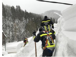
12.1.2019 – Schneeeinsatz in Annaberg