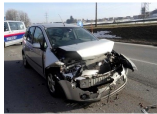
7.2.2019 – B37 – Auffahrunfall