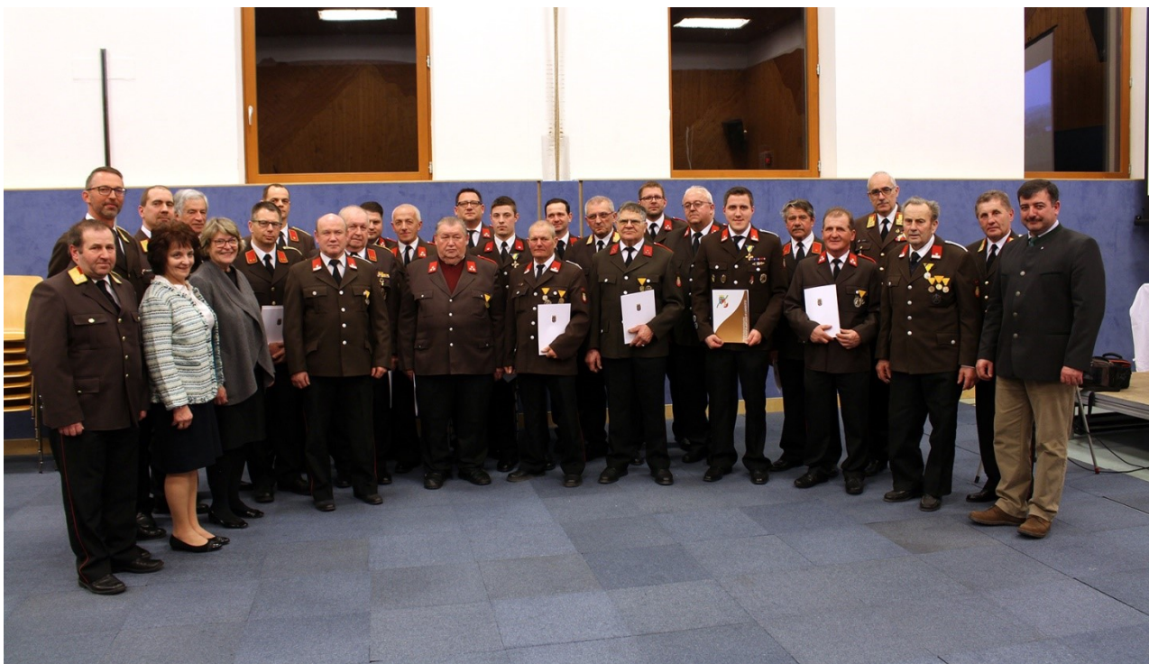
Die geehrten Feuerwehrmitglieder aus den 10 Feuerwehren der Gemeinde Gföhl mit den Ehrengästen.