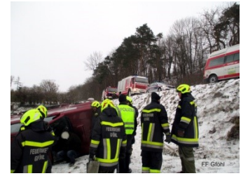
3.1.2019 – Unfall Wurfenthalstraße