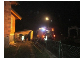
16.3.2019 – Kellerbrand – Haus in Gföhl