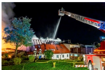
15.9.2019 – Drehleiter Gföhl – Brand Niedergrünbach