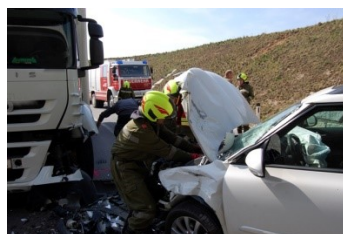
2.4.2019 – B37– Gföhl–Ost/PKW gegen LKW