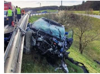
01.04.2023 – B37 – PKW unter Leitschiene