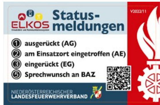
Abbildung 2: Status-Meldung ELKOS

Die Liste der Statusmeldungen befindet sich in jedem Fahrzeug in der Nähe des Fahrzeugfunkgerätes.