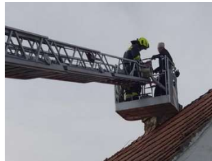
01.05.2023 – Kaminbrand in Eisenbergeramt