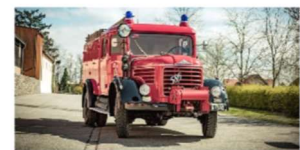
Baujahr 1963 ist das erste Tanklöschfahrzeug der FF Gföhl, der legendäre Steyr 586, ausgestattet mit 2000 Liter-Wasserkapazität, Altrad und Sullwänd.

Im Jubiläumsjahr 1993 wurde das verdienstvolle Einsatzfahrzeug einer Generallieutenant unterzogen (siehe Bericht aus unserem Archiv unten).