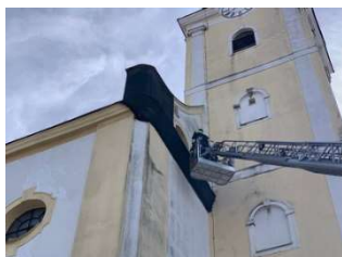
13.10.2023 – Pfarrkirche - Sicherungsarbeit