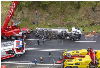
17.04.2023 – B37 – Tanker kippte um