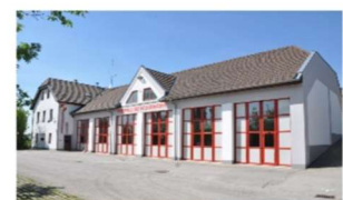
Genau ein Jahr nach dem Spatenstich für das neue Feuerwehrhaus der FF Gföhl in der Bergstraße 29 fand am Sonntag, 24. Oktober 1993, die feierliche Übergabe und Eröffnung des neuen Hauses statt.