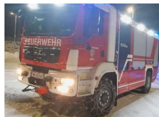
02.12.2023 - 7 Einsätze nach Schneefall