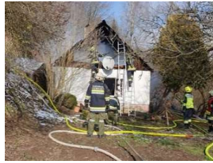
28.02.2023 – Zimmerbrand in Gföhleramt