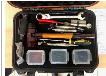
1 Set für Türöffnungen - stationiert im KLF