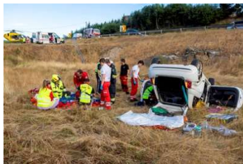
28.07.2023 – B37 – PKW in Auffangbecken