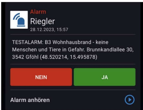
Abbildung 1: Blaulicht SMS bei Alarmierung