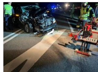
19.10.2023 - B37 – PKW gegen Traktor