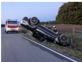
16.10.2023 – L57 – Pickup stand Kopf