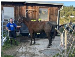
25.09.2023 – Pferd aus Schlammloch gerettet