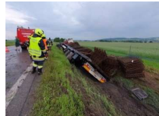
09.06.2023 – B37 – Sattelzug im Graben