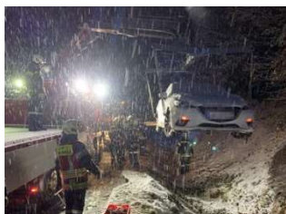
01.12.2023 - B37 - Menschenrettung