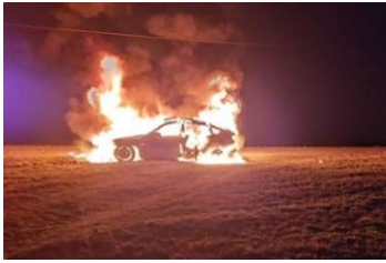
14.02.2023 – PKW brannte vollständig aus