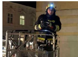
10.10.2023 – Tierrettung vom Kirchturm