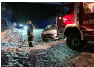
1.12.2023 - B37 – PKW gegen Brückenmuer