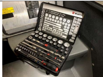
1 Steckschlüssel-Satz - stationiert im RLFA