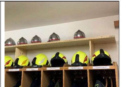
Ablage für Traditionshelme - Spende der Tischlerei Höllerer